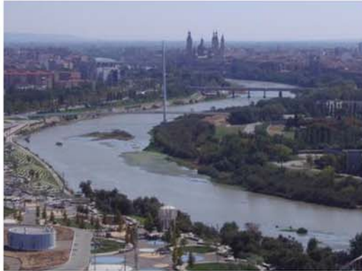
El proyecto europeo Rehabitat dibuja en Zaragoza su ciudad ideal

El proyecto europeo Rehabitat se ha clausurado con el impulso de la puesta en marcha una plataforma en Red para el Intercambio de Experiencias y Buenas Prácticas Rehabitat. Con el acento puesto en el factor humano, autoridades y técnicos españoles y franceses han valorado los tres años de cooperación que esperan retomar en 2014.