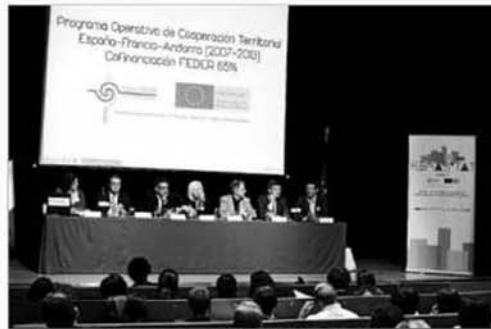
En el seminario participaron más de 90 profesionales.

El proyecto ha sido financiado a un 65% por los fondos Feder. Todos las partes implicadas se mostraron optimistas a la hora de recibir nuevos fondos. En todo caso, mantendrán la colaboración en materia de rehabilitación urbana de cara al futuro.